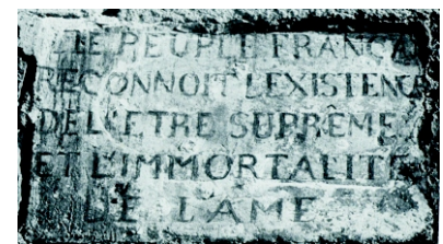
Le décret Robespierrieste du 7 mai 1794