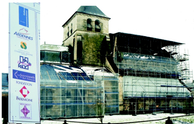
A rendre jalouses plus d'une cathédrale !

Elle a été construite en plusieurs étapes : le chœur et la nef vers 1155, les bas-côtés voûtés au siècle suivant. Puis subissant les assauts de gens de guerre sans scrupules et de pilliers au XVI ème siècle, l'église devint défensive en se dotant de meurtrières et servit alors de refuge à la population. Simultanément, furent construites les chapelles latérales au chœur central. Le duc et la duchesse de Mazarin du Rethélois, Charles de la Meilleraye et Hortense Mancini offrent, en 1704, l'autel principal et les orgues.